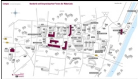
Lageplan der MakerLabs