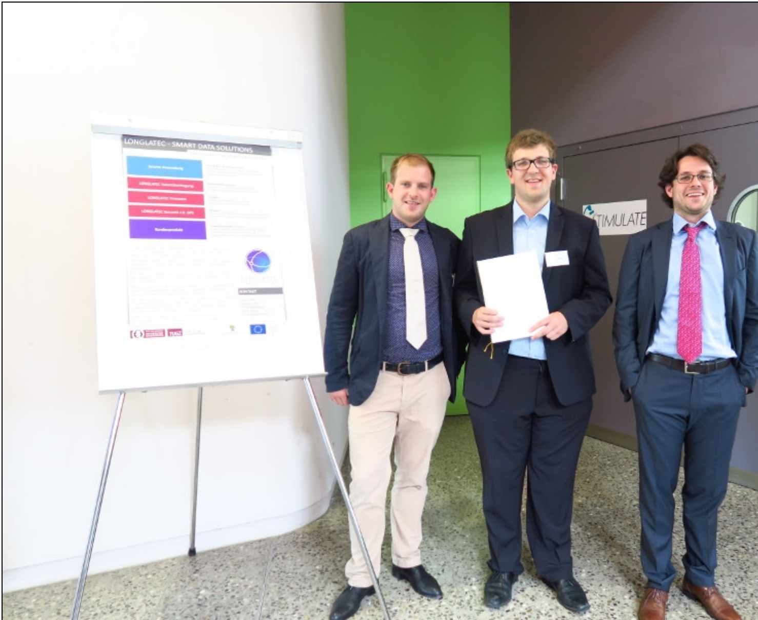
« Zurück Gründerteam Loglatec freut sich über die Förderung (Bild 3 von 5) » Vorwärts »