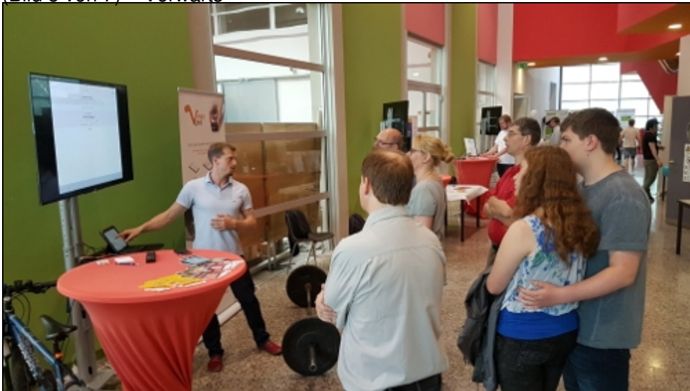
« Zurück VmaxPro (Bild 6