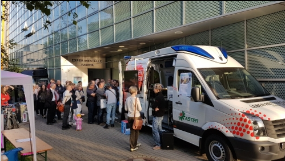
ExFa (Bild 1 von 7)»