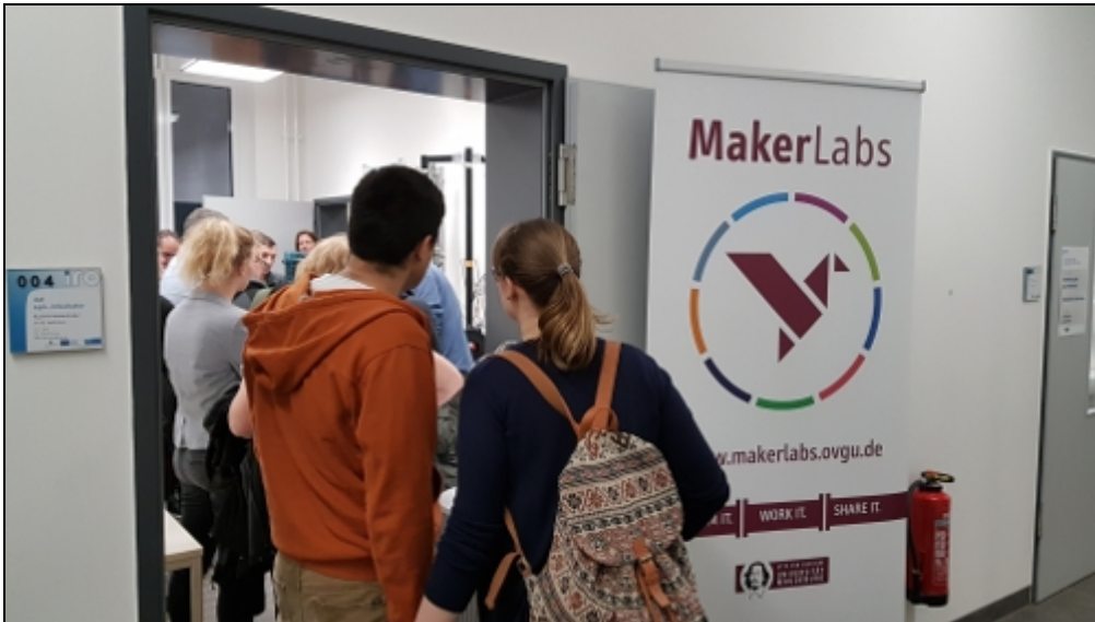
2 von 7) » Vorwärts