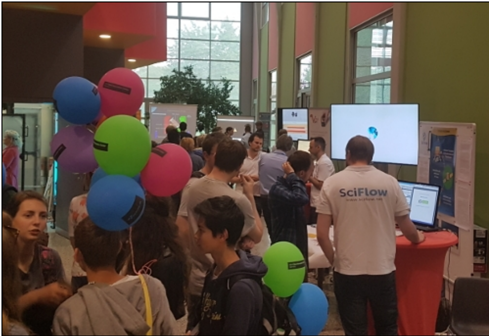
« Zurück SciFlow Stand