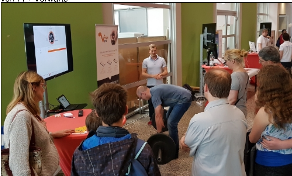
« Zurück VmaxPro Hantel