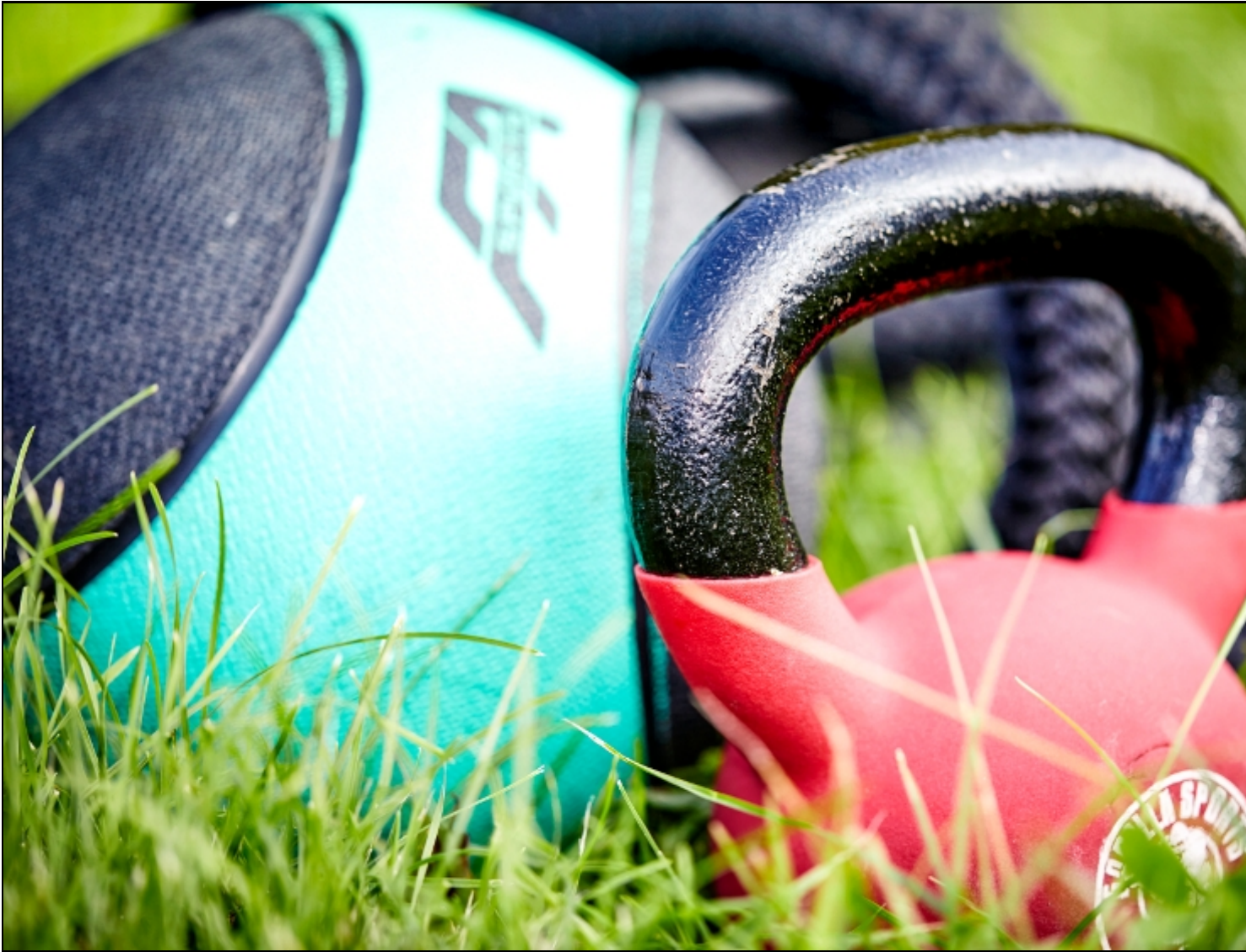
NaturImPuls (Bild 1 von 10) » Vorwärts